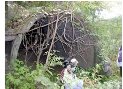
▲O 布引立坑風洞（坑内通気の扇風機）