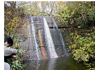
▲N 幌内水源地（炭鉱の上水道施設）