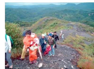
▲P ズリ山（石炭を選別した後に出る岩石を積み上げた人工の山）